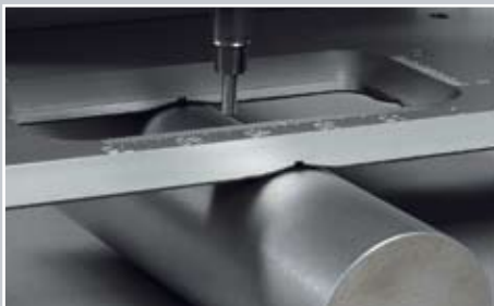
סימון על חלקים עגולים

פין הסימון האלקטרומגנטי הופך את ה FlyMarker ® למכשיר סימון עצמאי, המספק עוצמה גדולה ברעש נמוך. הוא אף מאפשר סימון איכותי וברור על משטחים בעלי גובה לא אחיד. הטקסט המסומן באמצעות המכשיר מורכב מנקודות בודדות, המצטרפות לאותיות ומספרים. ניתן לקבוע את צפיפות הנקודות בכל אות - 5 X 7, 9 X 13, או קו רצוף. אם הטקסט לסימון ארוך מדי, המכשיר דוחס את האותיות באופן אוטומטי.