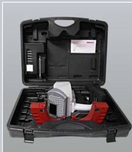
מזוודה ייעודית לנשיאה והגנה על המכשיר.

זהו המכשיר המושלם לסימון מהיר, גמיש, עמיד, ברעש נמוך ומתאים כמעט לכל חומר - החל מפלדות מחוסמות, דרך אלומיניום ופלסטיק, ועד חומרים רגישים ללחץ, דקים, מצופים או בעלי גימורים עגולים.